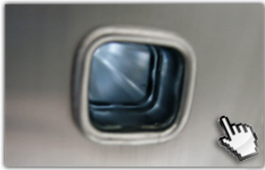
4-fach gebördelte Sprossen-Holmverbindungen