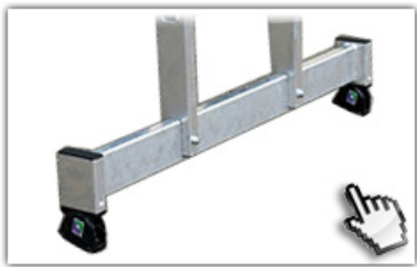
nivello® - Traverse extra hohe Standsicherheit

Vielweckleiter mit 0,85m breiter Nivello-Traverse und beidseitig rutschsicheren nivello-Leiterschuh für extra sicheren Stand und hohe Arbeitssicherheit.