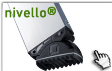
nivello® - Leiterschuhe 4-fach größere Auflagefläche