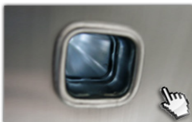
4-fach gebördelte Sprossen-Holmverbindungen