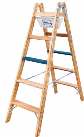
▲ Abbildung „Stufen-Stehleiter ERGO-Plus 2x5 Stufen“ (Art.-Nr. 2105-7)