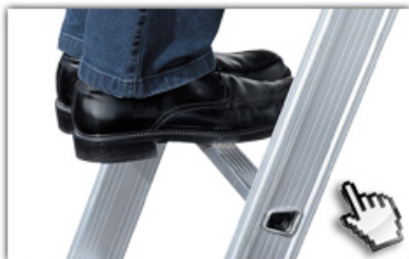
32mm tiefe, gewinkelte Trapezsprossen