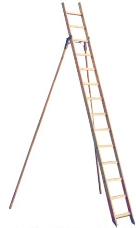
⚠ Abbildung abweichend! (Abb. Gartenleiter mit 14 Sprossen)