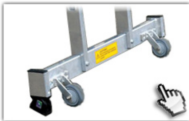
Roll-bar - Traverse Rücken schonender Ortswechsel