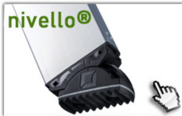
nivello® - Leiterschuhe 4-fach größere Auflagefläche