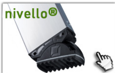
nivello® - Leiterschuhe 4-fach größere Auflagefläche

GS-geprüft, entsprechend europäischer Norm DIN EN 131, Betriebssicherheitsverordnung (BetrSichV), TRBS 2121, Handlungsanleitung BGI 694 und geltenden Unfallverhütungsvorschriften